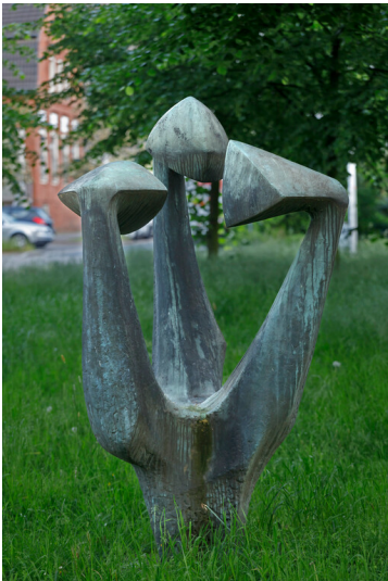
Die dreifach gegliederte, abstrakte Bronzeplastik "Erwachende Kraft" vor dem Bahnhof Hilden (2024). Fotograf/Urheber: Rainer Hotz