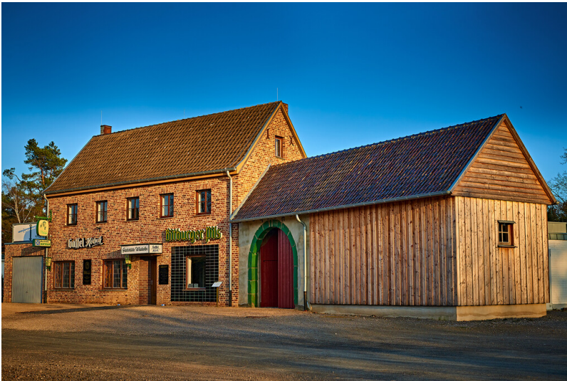
Ansicht der Baugruppe Marktplatz Rheinland im LVR-Freilichtmuseum Kommern (2017).