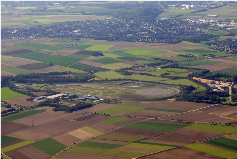
Schrägluftbild in nordwestliche Richtung auf die Automobilteststrecke und den Autobahnnachbau in Aldenhoven-Siersdorf, im Hintergrund Baesweiler-Setterich (2015).