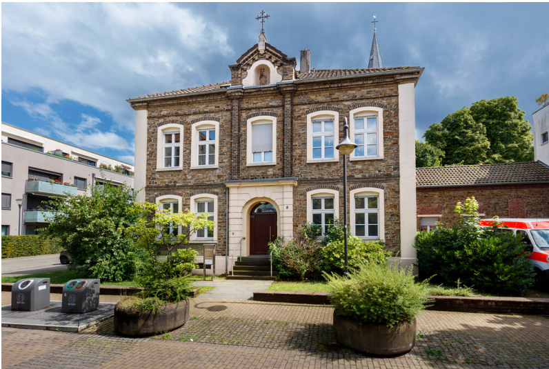
Das 1881/1882 gebaute Alte Pfarrhaus der Kirchengemeinde Sankt Jacobus (2024), Ansicht von der Mühlenstraße aus.