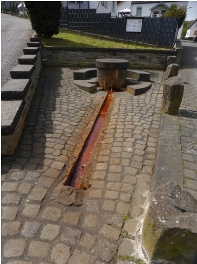
Sauerbrunnen in Oberzissen (2024)