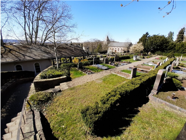
Terrassen des Friedhofs Küdinghoven