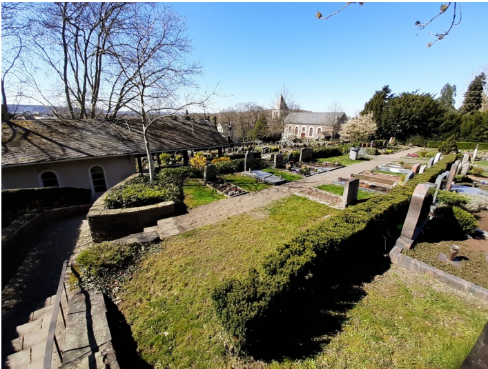
Terrassen des Friedhofs Küdinghoven