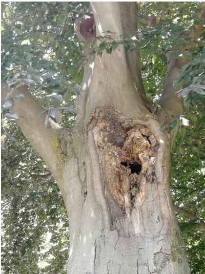
Faulhöhle auf dem Friedhof Buschdorf