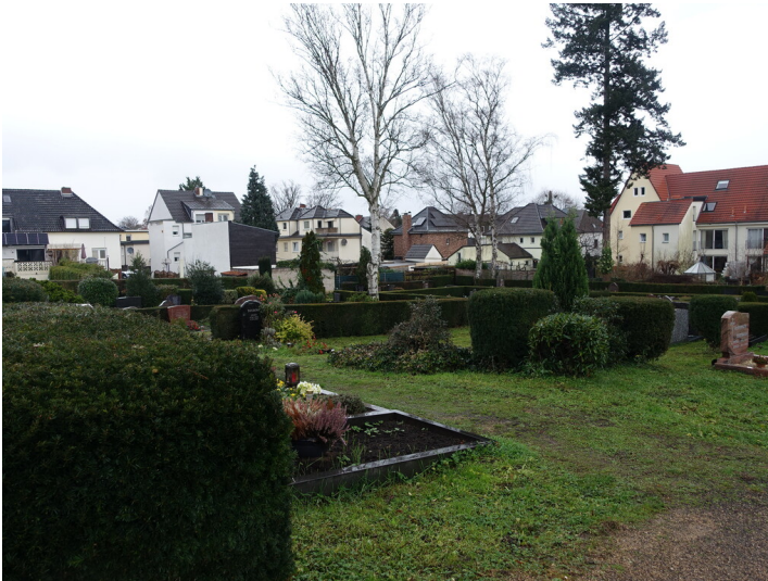
Überblick über Friedhof Lannesdorf