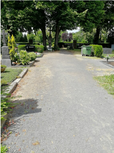
Hauptweg auf dem Friedhof Graurheindorf