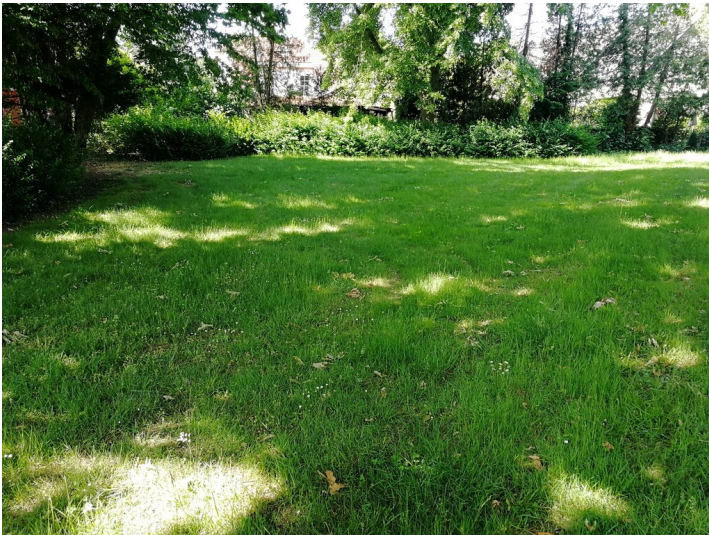
Rasen auf dem Friedhof Vilich-Müldorf