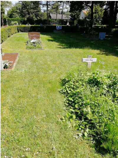
Rasenfläche Friedhof Schwarzhemdorf