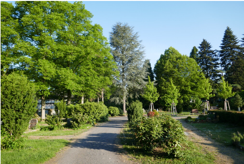
Friedhof Rüngsdorf