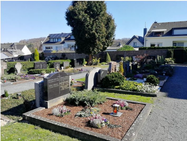
Übersicht über den alten Friedhof Lengsdorf