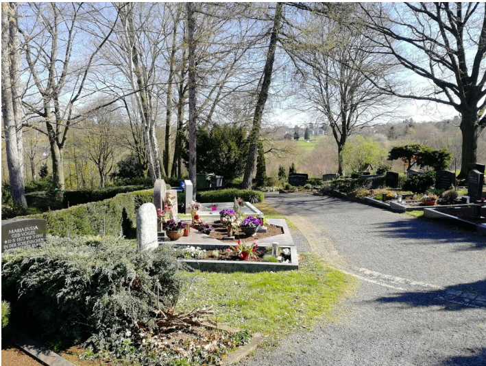
neuer Friedhof Lengsdorf