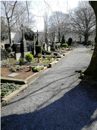
Alter Friedhof Duisdorf