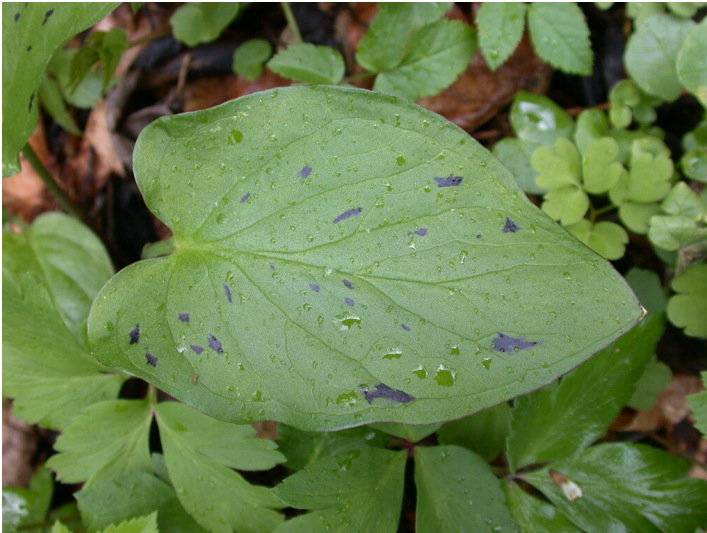
Blatt des Aronstabs auf dem Neuen Friedhof Kessenich