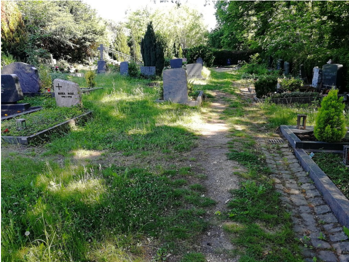
Alte Gräber auf dem alten Friedhof Ippendorf