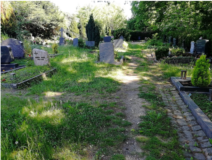
Alte Gräber auf dem alten Friedhof Ippendorf