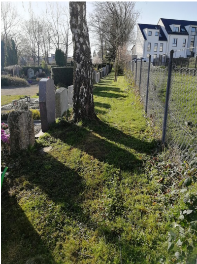
Rand des Friedhof Röttgen