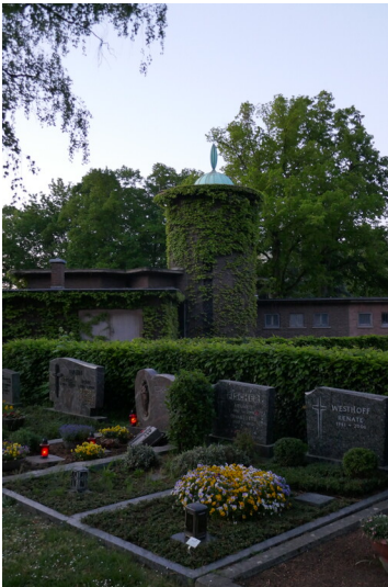
Kapelle und Gräber auf dem Zentralfriedhof