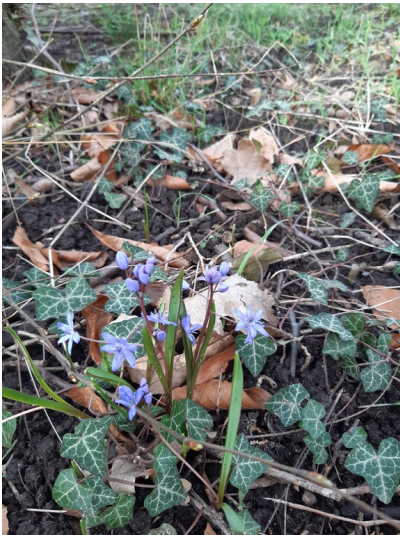
Zweiblättriger Blaustern