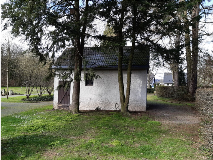
Wirtschaftsgebäude auf dem Friedhof Niederholtorf