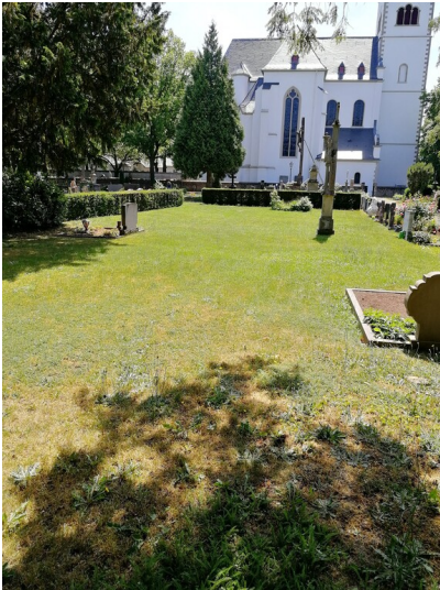
Stiftskirche am Friedhof Vilich