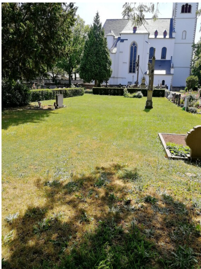
Stiftskirche am Friedhof Vilich