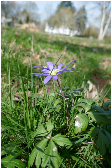
Anemona blanda