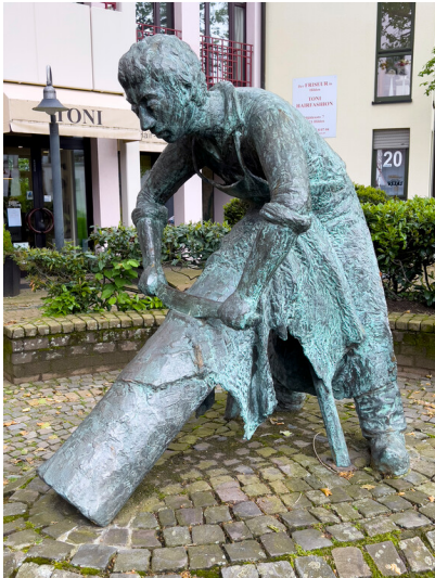
Die 1987 errichtete Bronzeplastik "Der Gerber" in einem kleinen Rondell vor der Wohnsiedlung Mühlenstraße in Hilden (2024). Das Werk des Künstlers Olaf Höhnen erinnert an die großen Gerbereien und Lederfabriken, die bis 1860 bis 1961 auf diesem Gelände in Betrieb waren.