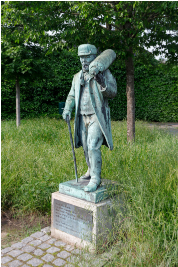
Bronzestatue des Handwebers Carl Hasbach, der bis 1913 als letzter Handweber in Hilden arbeitete (2024).