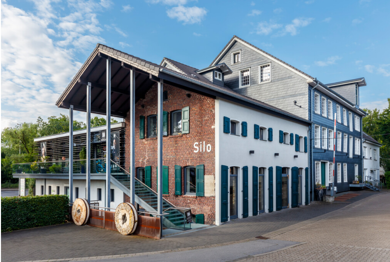
Gottschalks Mühle an der Itter in Hilden (2024).