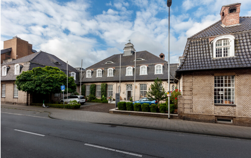
Hotel am Stadtpark in Hilden (2024). Das Gebäude wurde um 1900 erbaut als Hauptverwaltung des Textilunternehmens Kampf & Spindler.