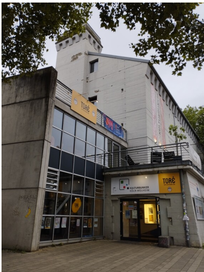
Frontansicht des ehemaligen Hochbunkers, heute Kulturbunker, in Köln Mülheim (2024).