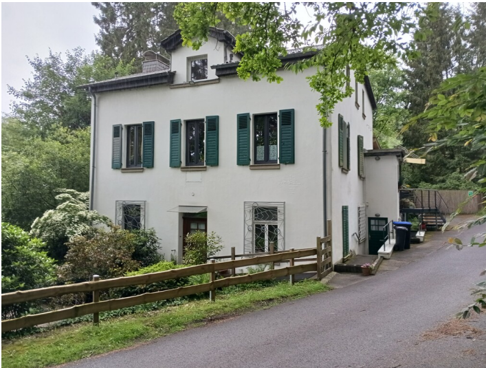
Das ehemalige Steigerhaus der Grube Berzelius liegt seitlich oberhalb des Volbachtals; Ansicht von Südosten (2024)