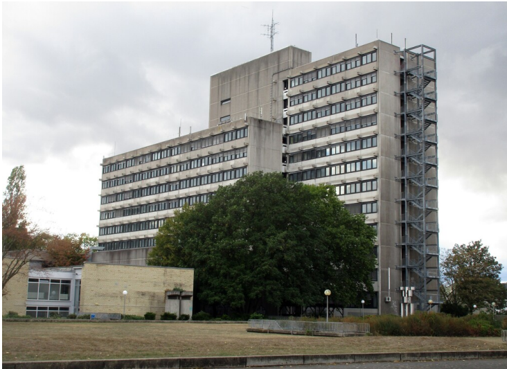
Das unter anderem als Universitätsgebäude der pädagogischen Fakultät genutzte Hochhaus in Bonn-Castell (2020), Ansicht von Westen her.