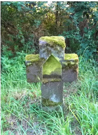
Basaltkreuz an der L113 zwischen Metternich und Hatzenport (2024)