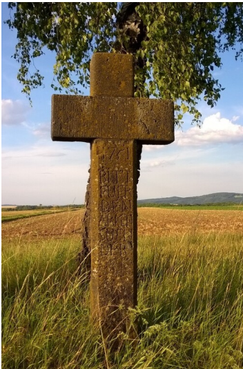
Basaltkreuz an der L113 zwischen Hatzenport und Metternich