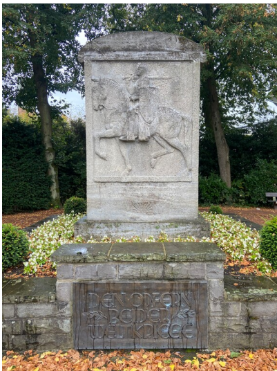
Das Kriegerdenkmal an der Ecke Friedensstraße/Maubisstraße in Kaarst zeigt das Relief eines Kriegers zu Pferd. Die Gedenktafel, die das Monument "den Opfern beider Weltkriege" widmet, wurde nachträglich angebracht (2024).