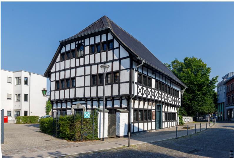
Das Haus auf der Bech in der Schwanenstraße 17 in Hilden, Ansicht der nach Süden gerichteten Giebelseite (2024).