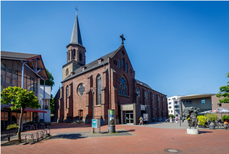
Ansicht der Jacobus-Kirche von der Mittelstraße aus gesehen (2024), auf dem Vorplatz die Bronzefigur der Pandora.