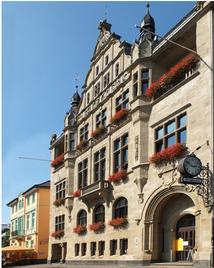
Das Bürgerhaus und ehemalige Rathaus in Hilden, von der Mittelstraße aus gesehen (2013).