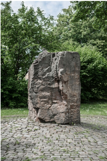
Gedenkstein für die Gefallenen der Weltkriege in Kaarst-Driesch (2019).