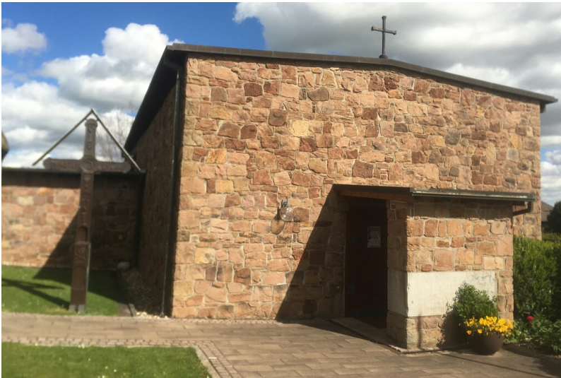
Die Kirche St. Albertus Magnus in Kreuzau-Leversbach (2024), Ansicht von Süden.