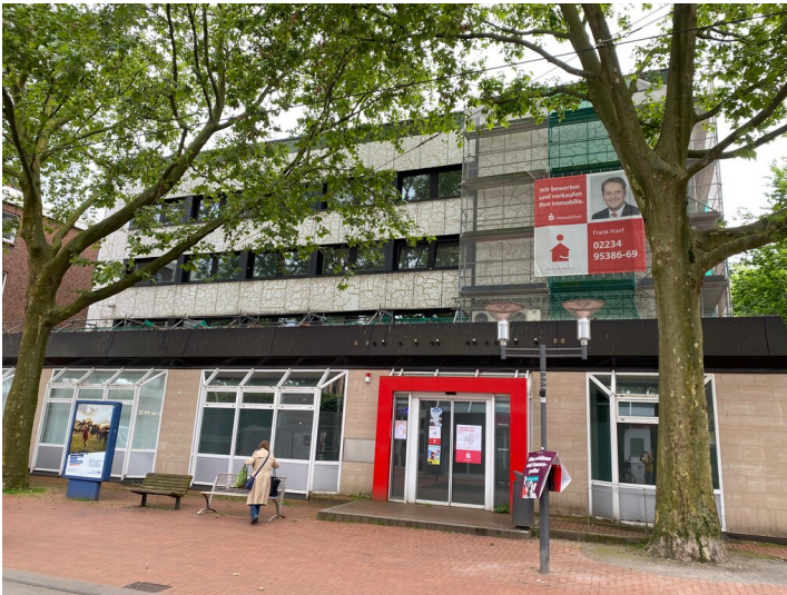
Gebäude der Kreissparkasse Frechen mit KerAion-Fassade (2024)