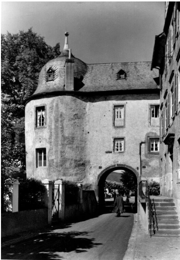
Zolltor in Leutesdorf von Süden (1955)