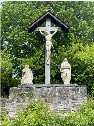
Siechenkreuz in Leutesdorf (2024)

Schlagwörter: Gedenkkreuz Fachsicht(en): Landeskunde Gemeinde(n): Leutesdorf Kreis(e): Neuwied Bundesland: Rheinland-Pfalz