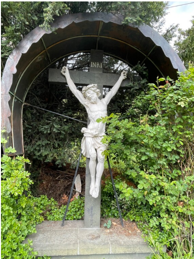
Linngässerkreuz in Leutesdorf (2024)