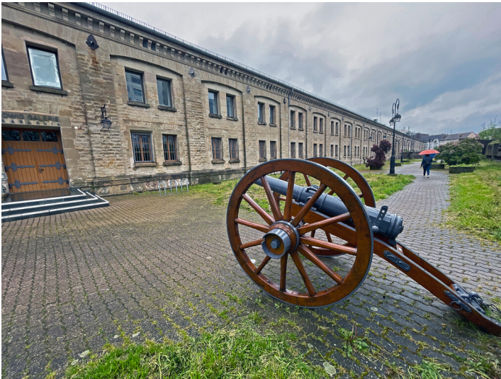
Kaserne VI in Saarlouis (2024)