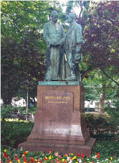
Das 1903 enthüllte Denkmal für den katholischen Priester und Begründer des Kolpingwerkes Adolph Kolping (1813-1865) am Kolpingplatz in Köln-Altstadt-Nord (2024).