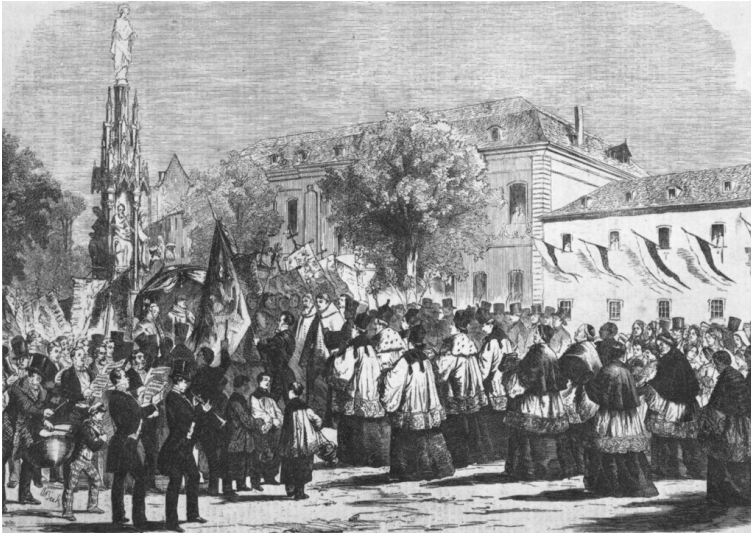
Darstellung der Einweihungsfeier der Kölner Mariensäule an ihrem ersten Standort vor dem erzbischöflichen Palais (1858).