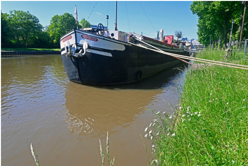
Theaterschiff Maria-Helena in Saarbrücken (2024)