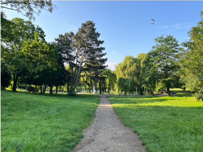
Blick auf Flora und Fauna des Stadtgartens Köln-Mülheim von der Stadthalle Köln aus (2024).