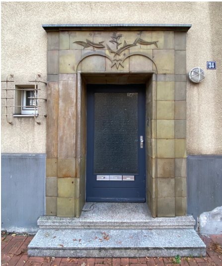
Doppelwohnhaus mit Baukeramik der Köln-Frechener Keramik (Ooms) (2024)